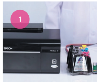
Установка СНПЧ. Рис. 1

В случае несовпадения, порядок должен быть изменен!