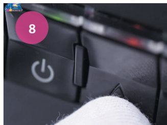
Обновление уровня чернил. Рис. 8

2 Зажмите кнопку обновления над картриджами на 5-7 секунд (рис. 9). Нажмите кнопку «капля» (рис. 8). Закройте крышку принтера. Через несколько минут принтер будет готово к работе.