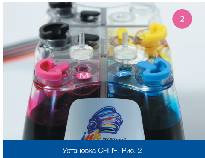
Установка СНПЧ. Рис. 2

2 Вытащите маленькие заглушки и аккуратно на их место установите воздушные фильтры (рис. 2). Обязательно сохраните заглушки для дальнейшей транспортировки принтера с установленной СНПЧ.