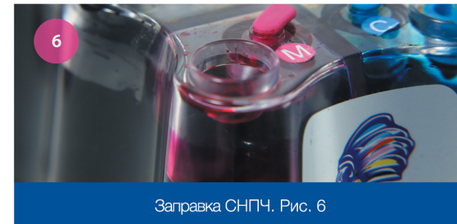
Заправка СНПЧ. Рис. 6

1 Для заправки СНПЧ закройте воздушные отверстия и откройте заправочные (рис. 6).