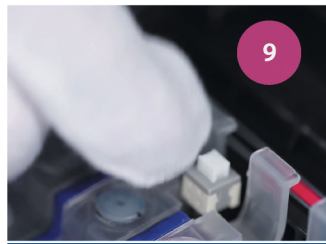
Обновление уровня чернил. Рис. 9

УБЕДИТЕСЬ, ЧТО ЧЕРНИЛ В ДОНОРАХ ДОСТАТОЧНО. В ПРОТИВНОМ СЛУЧАЕ ДОЗАПРАВЬТЕ ИХ. НЕ ДОПУСКАЙТЕ ТОГО, ЧТОБЫ ЧЕРНИЛА ОПУСКАЛИСЬ НИЖЕ КРАСНОЙ ОТМЕТКИ