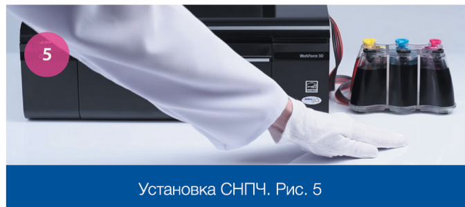
Установка СНПЧ. Рис. 5

8 Резервуары с чернилами должны находиться на уровне с принтером (рис. 5).