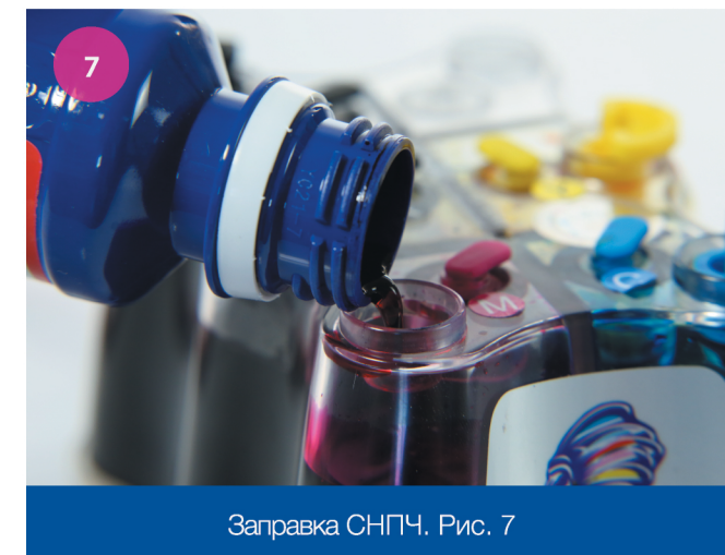
Заправка СНПЧ. Рис. 7

Заправка СНПЧ чернилами производится в соответствии с цветными пробкам на донорах. Используйте новый шприц для каждого цвета либо промывайте его теплой водой. Не допускайте смешивания чернил разных цветов, это может негативно повлиять на качество печати.