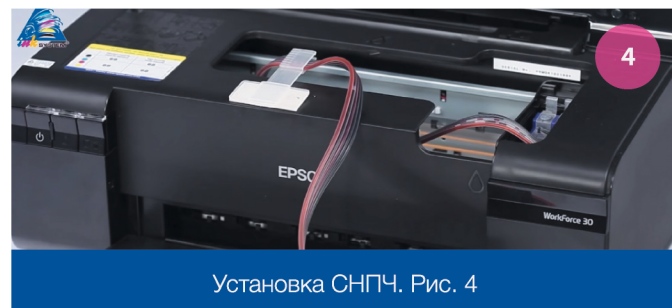
Установка СНПЧ. Рис. 4

6 Установите держатель на корпусе принтера примерно посередине и закрепите в нем чернильный шлейф (рис. 4). Для корректной работы принтера шлейф не должен быть перекручен.